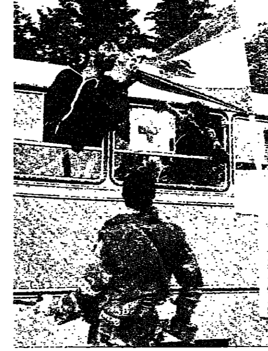
لقاء المعتقلين مع توبهم